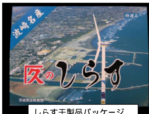
しらす干製品パッケージ